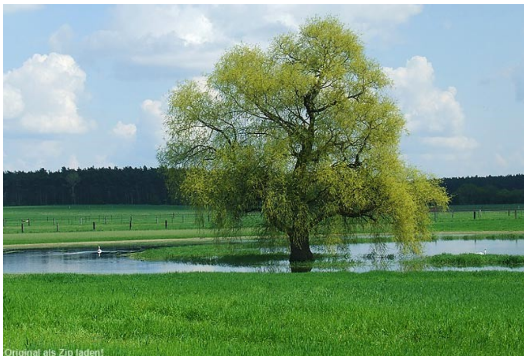
Original als Zip laden! Abbildung 2: Landschaft bei Lobetal

Donec interdum, metus et hendrerit aliquet, dolor diam sagittis ligula, eget egestas libero turpis vel mi. Nunc nulla. Fusce risus nisl, viverra et, tempor et, pretium in, sapien. Sed magna purus, fermentum eu, tincidunt eu, varius ut, felis. In auctor lobortis lacus. Quisque libero metus, condimentum nec, tempor a, commodo mollis, magna. Vestibulum ullamcorper mauris at ligula. Fusce fermentum. 2 Nullam cursus lacinia erat. Praesent blandit laoreet nibh.